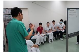
↑シミュレーションの後はデブリーフィングで振り返り